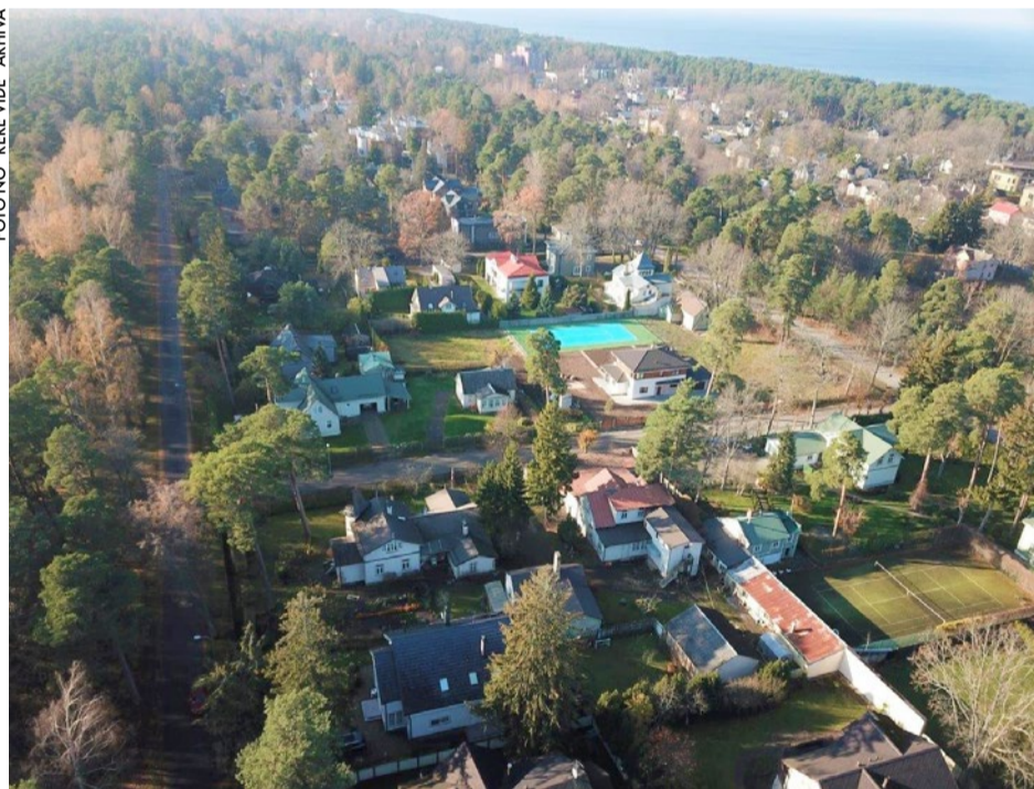
Ekspluatācijā nodoti ūdensapgādes un kanalizācijas tīkli posmā Dubulti–Pumpuri.