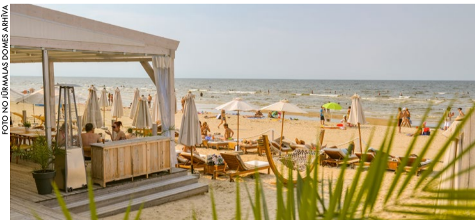
Nomātajos pludmales nogabalos uzņēmēji var izvietot kafējnīcas un sniegt atpūtas pakalpojumus jūrmalniekiem un kūrortpilsētas viesiem.

ELITA CEPURĪTE, Sabiedrisko attiecību nodaļa