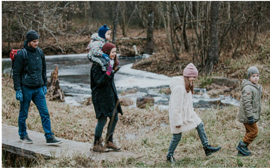
Jūrmalā ir ģimenēm draudzīga vide un plašas iespējas atpūtai, veselībai un sportam.

Līdz 12. decembrim norisinās iedzīvotāju balsojums konkursā "Ģimenei draudzīgākā pašvaldība". Izvērtēt pašvaldības sniegumu un balsot var vietnē www.vietagimenei.lv .