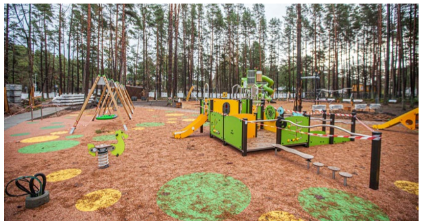
Mazākajiem parka apmeklētājiem tiks izbūvēti rotaļu laukumi kopumā 1240 kvadrātmetru platībā.