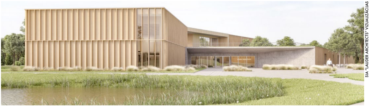
Jaunajā daudzfunkcionālajā dabas tūrisma centrā Ķemeros apmeklētājiem būs iespēja izglītoties, izzināt dabu un saturīgi pavadīt laiku.