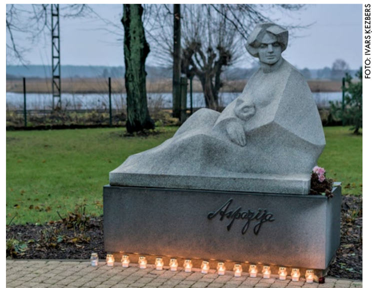
Pie dzejniecei veltītā pieminekļa taps “Baltās tautas” audeklis – sveiciens svētkos.

Pie dzejnieces pieminekļa Aspazijas mājas pagalmā (Z. Meierovica prospektā 18/20), simtgadīgajās liepās iesienot bārkstiņu – dzīpariņu, ikviens var nosūtīt savu sveicienu Latvijai, kopīgi veidojot “Baltās tautas” audeklu. Dzejoli “Baltā tauta” Aspazija atskatījās uz pagātnes cīņām par Latviju, kas ārdīja tautu un tās vienotību: “Tauta, mana baltā tauta, / Nav viena vien bārkstiņa, / Kas nostu rauta / No tava auta!” Pievienojot savu dzīparu kopējā audeklā, simboliski veidosim stipru tautas “saadumu”, sajūtīsim, ka esam daudz, esam stipri un vienoti, – aicina Aspazijas māja. Godinot Latvijas valsti un tās veidotājus, patriotisma nedēļā Aspazijas mājas pagalmā audioierakstā skanēs latviešu tautai un Latvijai veltīta Aspazijas dzeja.