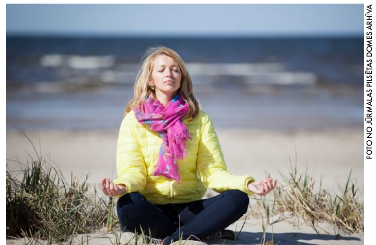
Lai piedalītos jogas nodarbībās, nav nepieciešamas priekšzināšanas.