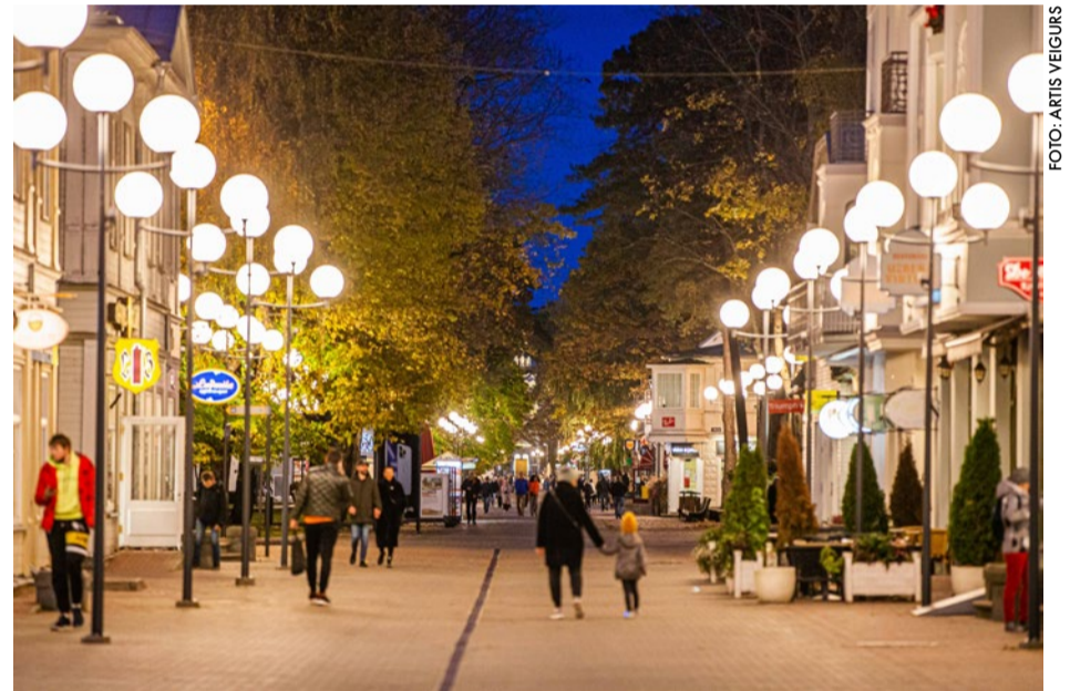
Jauns, ekonomisks apgaismojums izbūvēts Jomas ielā, saglabājot tai raksturīgos apaļā dizaina gaismekļus.

Interreg Baltic Sea Region EUROPEAN UNION