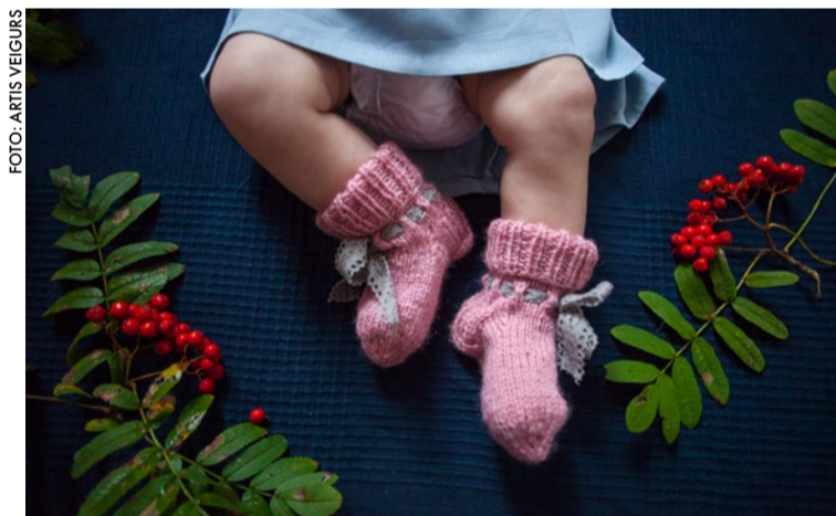
Divdesmit lekcijās jaunās ģimenes tiks iepazīstinātas ar veiksmīgas zīdīšanas galvenajiem nosacījumiem.

Mātes piens ir vispildvērtīgākā barība bērnam pirmos sešus dzīves mēnešus, dažu pētījumu rezultāti uzrāda, ka – pat visu pirmo dzīves gadu. Tāpēc topošos un jaunus vecākus sadarbībā ar Latvijas Zīdīšanas veicināšanas konsultantu asociāciju (LZVKA) aicinām apmeklēt tiešsaistē izglītojošas nodarbības par zīdīšanu. Aicinām piedalīties arī topošos un jaunus tēvus, kas ir neatsverams atbalsts un palīgs zīdīšanas procesā.