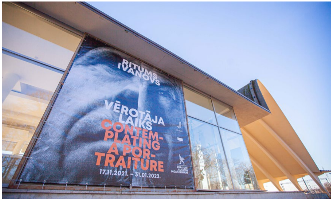
Laikmetīgās mākslas telpa – mākslas stacija “Dubulti” – atrodas funkcionējošā dzelzceļa stacijā.