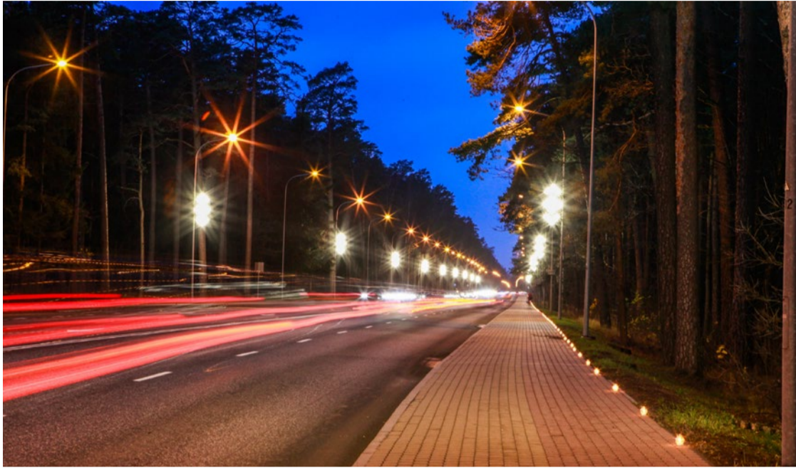
Gaismas ceļš daudzām jūrmalnieku ģimenēm jau no paaudzes paaudzē ir gaidīts un emocionāls notikums.

Jūrmalas īpašais ģeogrāfiskais novietojums – teritorijai izvijo- ties cauri Jūrmalas apkaimēm 30 kilometru garumā – arī bija pamudinājums uzsākt senākā un garākā Gaismas ceļa veidošanu, gaismeklīšus izvietojot centrālās ielas malā. Sākotnēji iepirktas 100 kūpošas vēja svēces no Dobeles sveču ražotāja, kuras Jūrmalas