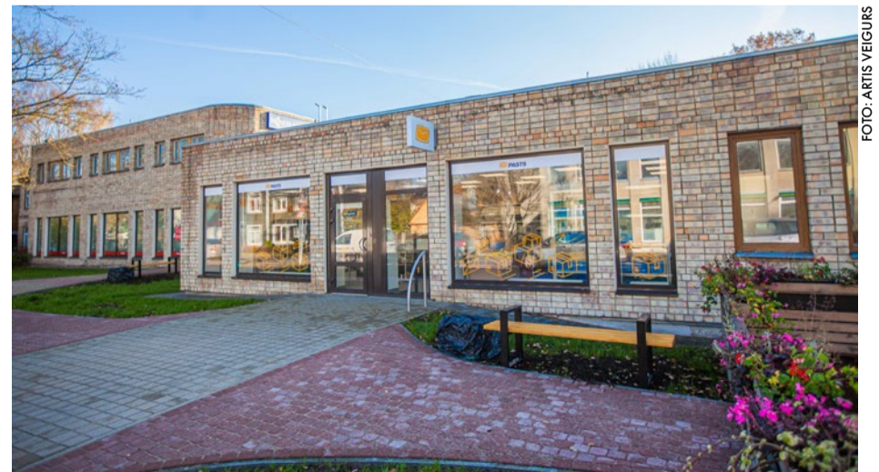
Majoru Pasta nodaļa ir ieguvusi gaišu, plašu un ērtu klientu apkalpošanas vidi, kas speciāli pielāgota komfortablai pasta pakalpojumu saņemšanai.