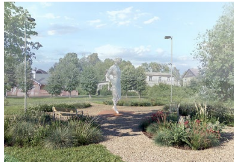
Skulptūrā atveidota jauna sieviete, kas pastaigājas, kavējoties atmiņās. Zieds sievietes rokās simbolizē cerību un ilgas pēc bezrūpīgiem laikiem.

Par dziesmas rašanos ir dažādi nostāsti. Tās pirmradītājs esot bi-