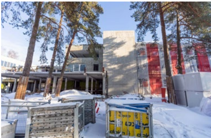
Skolai veikta daļēja būvkonstrukciju pārbūve un jumta izbūve, turpinās arī iekštelpu apdares darbi.