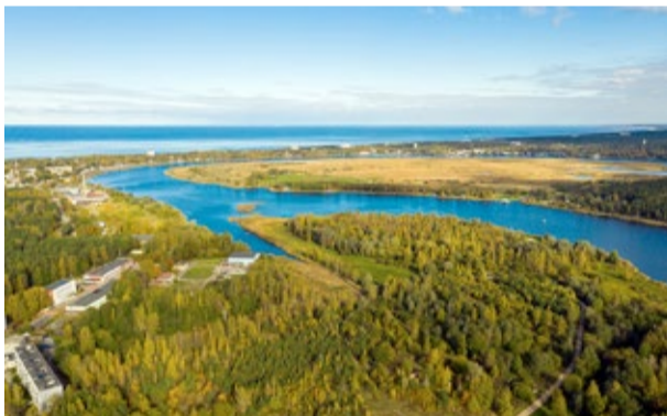
Iesaistoties ES iniciatīvā, Jūrmalas mērķis ir līdz 2030. gadam kļūt par klimatneitrālu pilsētu.

Atbalstīja Jūrmalas valstspilsētas pašvaldības dalību Eiropas Komisijas iniciatīvā “100 klimatneitrālas un viedas pil-