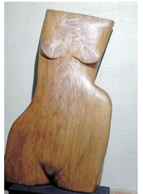
Matias Jansons. "XM". 2020.