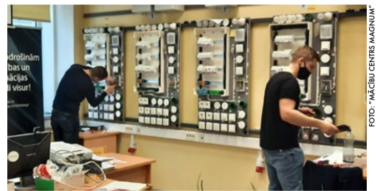
“Mācību centrs Magnum” Jūrmalā piedāvā apgūt elektrotehniķa un elektromontiera specialitāti vai pilnveidot zināšanas darbā ar elektrotehniku.

Mācībām var pieteikties strādājoši un pašnodarbināti Latvijas