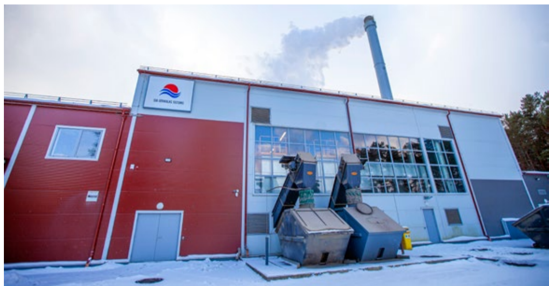
SIA "Jūrmalas siltums" siltumenerģijas ražošanā aptuveni puse ir biomasa (šķelda), bet otru daļu aizņem dabasgāze.

No 1. februāra Sabiedrisko pakalpojumu regulēšanas komisija (SPRK) Jūrmalā ir apstiprinājusi jaunu, par 10,12% augstāku siltumenerģijas tarifu, taču līdz 30. aprīlim valsts kompensēs tās izmaksas, kas pārsniedz 68,00 EUR/MWh.