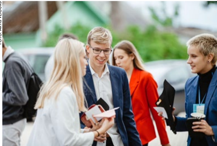
Jūrmalas jaunieši aktīvi īsteno projektus ar pašvaldības līdzfinansējumu. Arī šogad to var saņemt savu ideju īstenošanai, lai padarītu jauniešu dzīvi Jūrmalā interesantāku un aizraujošāku.

LAURA LAZDĀNE, Jūrmalas Jaunatnes iniciatīvu centrs