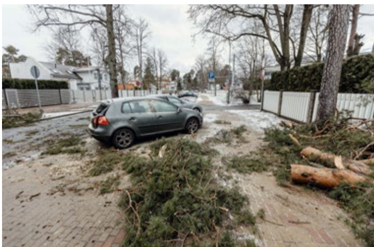
Uzreiz pēc vētras tika sākti lauzto koku un zaru novākšana.

Vētrā bojāto labiekārtojuma elementu piegādei un uzstādīšanai, ņemot vērā pastāvošos epidemioloģiskos ierobežojumus, būs nepieciešams papildu laiks, tādēļ nāksies pagarināt plānoto būvdarbu izpildes termiņu. Pilsētas atpūtas parka un jauniešu mājas izbūvi Kauguros plānots pabeigt un parku apmeklētājiem atvērt šogad vasaras nogalē.