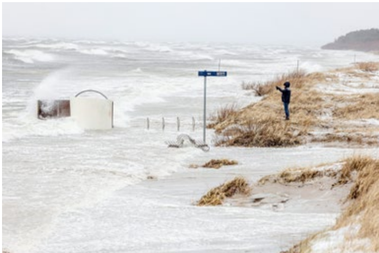
Vētras laikā ūdens skalojās līdz pat kāpu zonai. Atsevišķās vietās tika bojātas iebetonētās pārgērbšanās kabīnes, apgāzti soliņi, vietām izskalotas koka laipu noejas uz pludmali

Ap 100 koku nozāģēti un novākti pie ielām, skvēros un parkos pašvaldības teritorijās. Tāpat ir nolauzti un izgāzti koki pilsētas mežos, kur postījumu apmērs vēl nav apzināts, bet skaidrs, ka arī mežos būs nepieciešami sakopšanas darbi. Ap 100 koku nozāģēti un novākti pie ielām, skvēros un parkos pašvaldības teritorijās. Tāpat ir nolauzti un izgāzti koki pilsētas mežos, kur postījumu apmērs vēl nav apzināts, bet skaidrs, ka arī mežos būs jāveic kopšanas darbi.