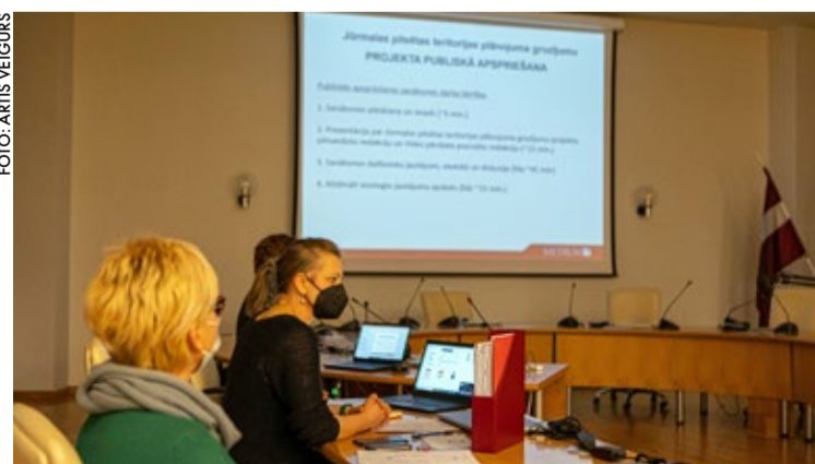
Publiskās apspriešanas sanāksmēs iedzīvotāji varēja iepazīties ar veiktajiem grozījumiem teritorijas plānojumā, saņemt atbildes uz jautājumiem un sniegt savus priekšlikumus.