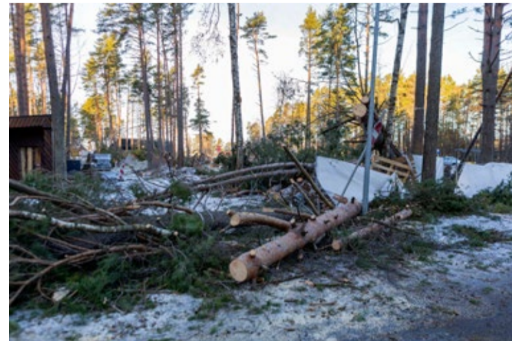
Spēcīgākie postījumi nodarīti Kauguru parka būvobjektā, kur neatgriezeniski bojāti vairāk nekā 150 koki. Krītošie koki radījuši būtiskus bojājumus parkā jau izbūvētajai infrastruktūrai.

Vētra radījusi postījumus visā pludmales garumā posmā no ietekas Rīgas jūras līcī līdz Jaunķemeriem, kur vētras laikā ūdens skalojās līdz pat kāpu zonai. Atsevišķās vietās tika bojātas iebetonētās pārgērbšanās kabīnes, kas paredzētas cilvēkiem ar īpašām vajadzībām, apgāzti soliņi, vietām izskalotas koka laipu noejas uz pludmali, bojāti to posmi, nolauzti un aizskaloti kārklu stādījumi. Nākamajā dienā pēc vētras pašvaldība operatīvi uzsāka pludmales sakopšanas darbus, arī pludmales nogabalu nomnieki tika aicināti sakopt nomātos nogabalus. Lielākie postījumi konstatēti pludmales centrālajā daļā (Majori-Dzintari), kur stipri bojāta pludmales promenāde – koka laipa, kas izvietota paralēli priekškāpām posmā no Turaidas ielas līdz Tirgoņu