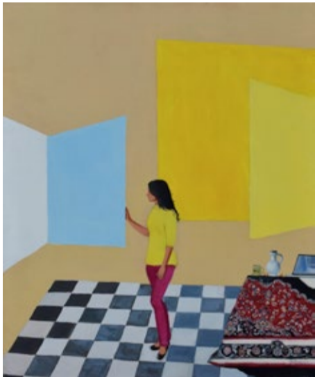
Dagne Ventiņa. "Skatoties pa logu". 2020.