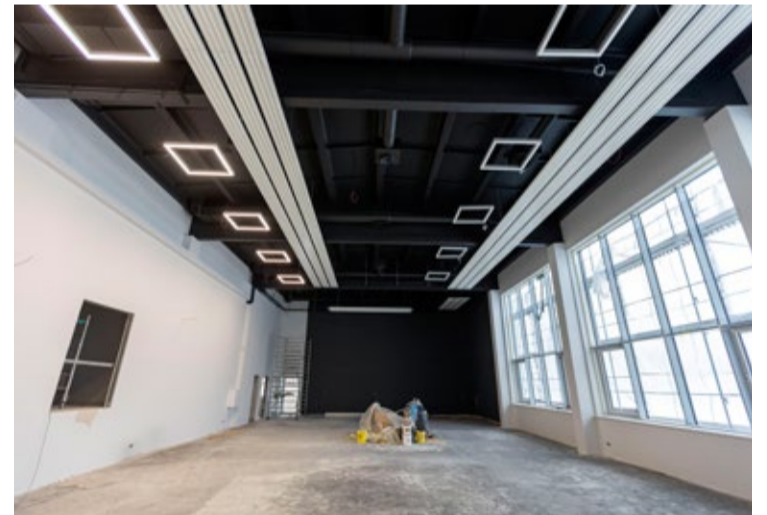
Jūrmalas Valsts ģimnāzijas aktu zāle atradīsies ēkas pirmajā stāvā.