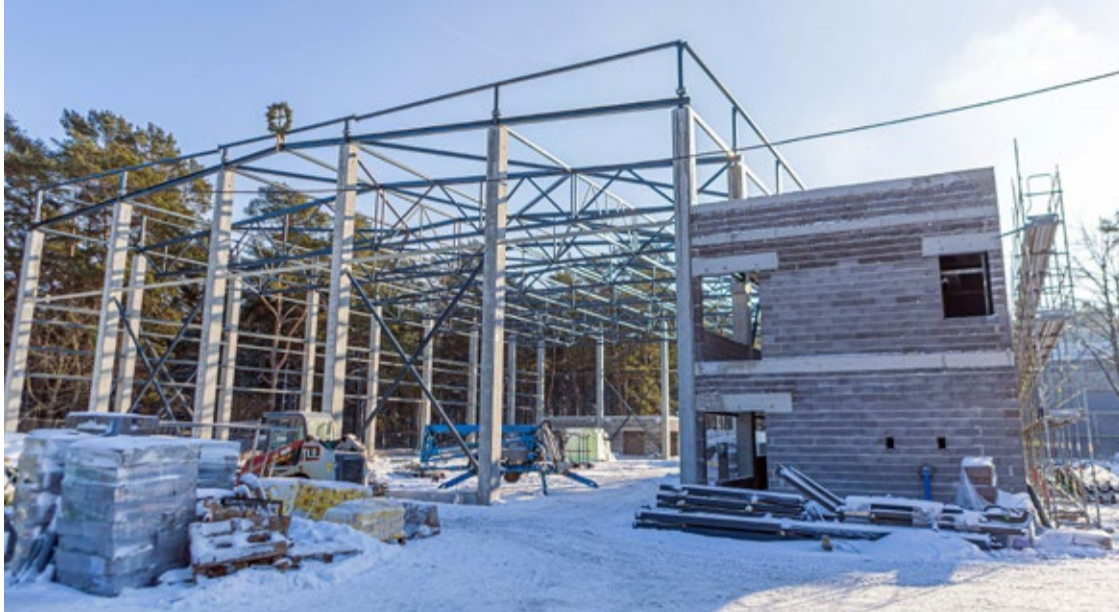
Aspazijas pamatskolas sporta zāles ēka Lielupē ieguvusi savas aprises.

Jūrmalā turpinās vērienīga izglītības iestāžu modernizācija, atjaunojot un no jauna izbūvējot vairākas izglītības iestādes – Aspazijas pamatskolu un sporta zāli, Jūrmalas Valsts ģimnāziju un pirmsskolas izglītības iestādi “Biīte”. Šajā gadā Jūrmalas valstspilsētas pašvaldība izglītības iestāžu remontos un telpu modernizācijā ieguldīs vairāk nekā 12,89 miljonus eiro.