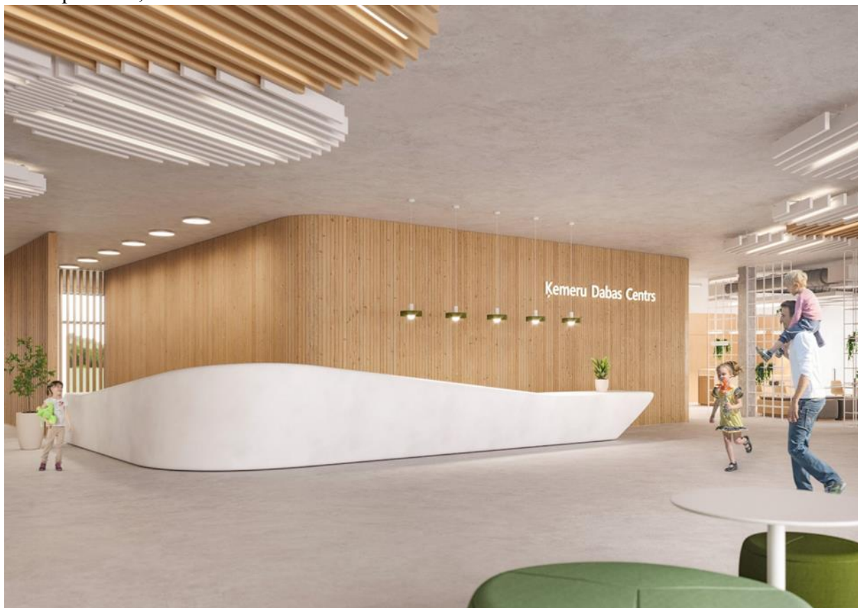
Attēls 1 Autors SIA "Lauder Architects"