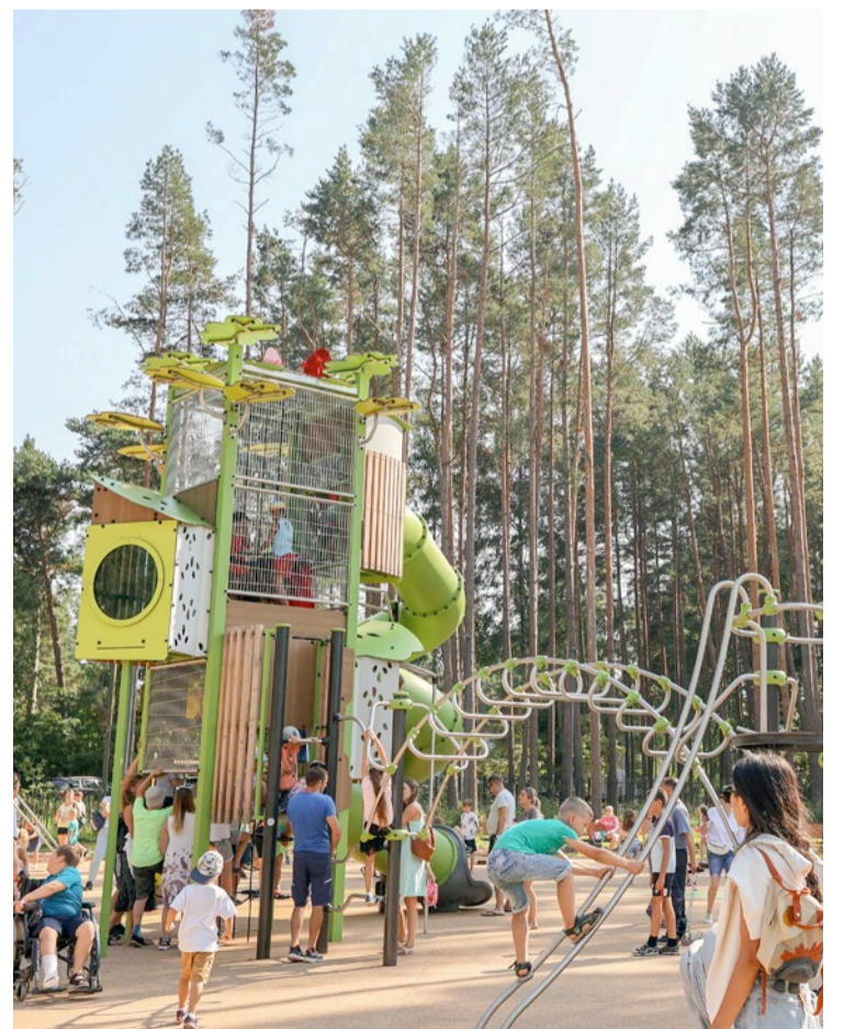
Par jaunajiem rotaļu laukumiem priecīgas ģimenes ar bērniem, viens no iecienītākajiem rotaļu laukuma elementiem atklāšanas dienā – jaunie slīdkalniņi.