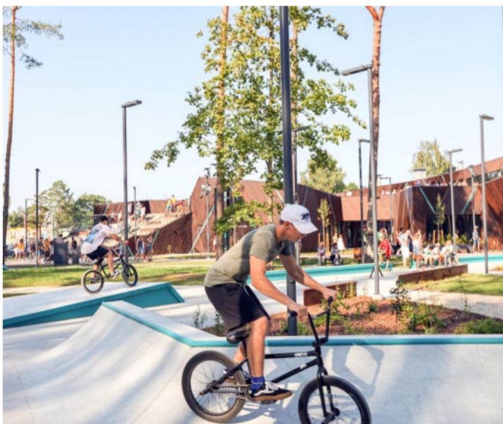
Parkā ierīkots 915 kvadrātmetrus plašs skeitparks, ko jau pirmajās dienās iecienījuši kā Jūrmalas jaunieši, tā bērni no kaimiņu pilsētām. Daļu skeitparka klāj jumts.

vajadzībām, nodrošināt komercdarbības attīstībai labvēlīgus apstākļus Jūrmalā, izveidojot pilsētas atpūtas parku un jauniešu māju Kauguros, atbilstoši Jūrmalas pil-