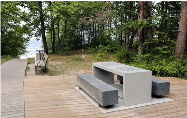
Izstaigājot nepilnus divus kilometrus garo dabas taku, var iepazīt apkārtnes dabas vērtības, baudīt nesteidzīgu atpūtu, kā arī lietot vingrošanas ierīces fiziskām aktivitātēm.

tiek finansēts no EJZF līdzekļiem. Projekta mērķis ir piekrastes teritorijas saglabāšana un attīstība, piekrastes infrastruktūras sakārtošana un attīstīšana, nodrošinot cilvēku plūsmas organizēšanu teritorijā un