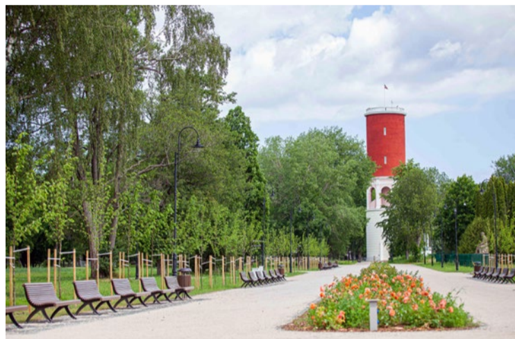
Atjaunotais vēsturiskais Ķemeru parks saņēma žūrijas augstāko atzinību.

un restaurācijas darbiem pārbūvētas arī apkārtējās ielas un izbūvētas jaunas autostāvvietas automašīnu un tūristu autobusu novietošanai. Ķemeru vēsturiskā parka atjaunošanas būvprojektu izstrādāja SIA "Livland Group", parka atjaunošanas darbus veica pilnsabiedrība "RERE BMW", būvuzraudzību nodrošināja piegādātāju apvienība "SIA "Isliena V" un SIA "Jurēvičs un partneri"". Projekta "Ķemeru