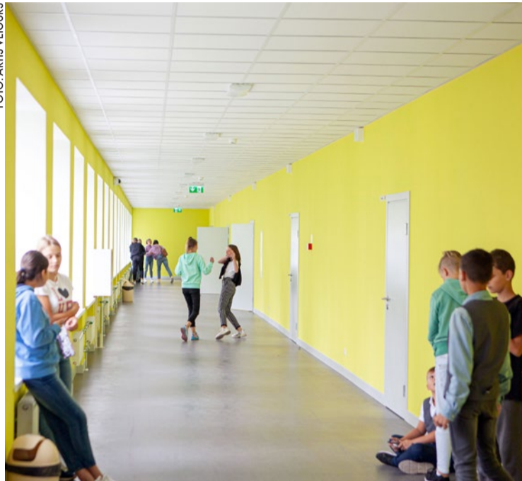
Sniedzot atbalstu ģimenēm ar bērniem, arī turpmāk 1.–12. klašu skolēniem Jūrmalas pašvaldības skolās būs nodrošinātas brīvpusdienas.

Brīvpusdienām skolās un bērnudārzos pašvaldības budžetā 2022. gadam bija plānoti 1,75 miljoni eiro, izmaksu pieaugums no 1. septembra prasīs papildu 148 tūkstošus eiro. No 1. septembra izmaksas par vienu