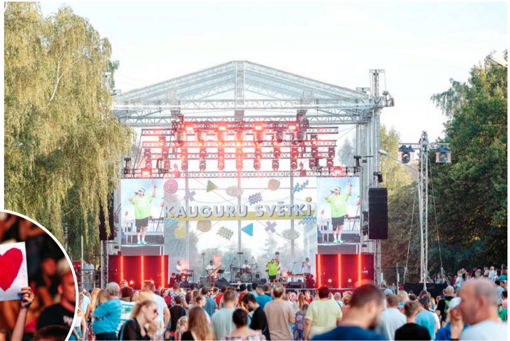
Visas dienas garumā Kauguros skanēja muzikāli priekšnesumi un norisinājās daudzveidīgas radošas un sportiskas aktivitātes.