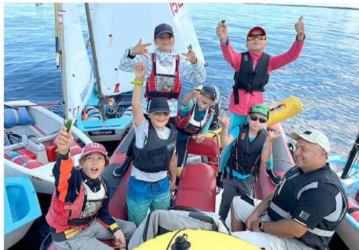
Jūrmalniekiem šīs sacensības noslēdzās ar labiem rezultātiem un godalgotām vietām.

Lielupes grīvā un Rīgas jūras līcī pie Lielupes grīvas augustā notika “Optimist” jahtu klases Latvijas kausa 5. posma regate “Jūrmalas kausis”, kur labus rezultātus un godalgotas vietas guva Jūrmalas Sporta skolas burātāji.