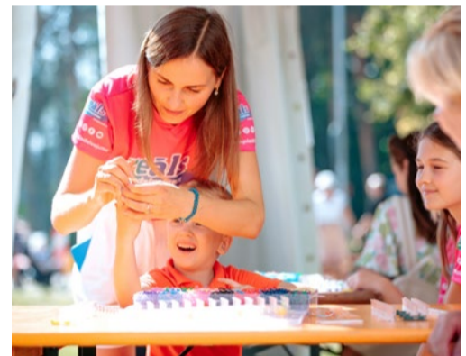
Ikviens svētku apmeklētājs varēja izgatavot draudzības rokassprādzi sev un draugam.