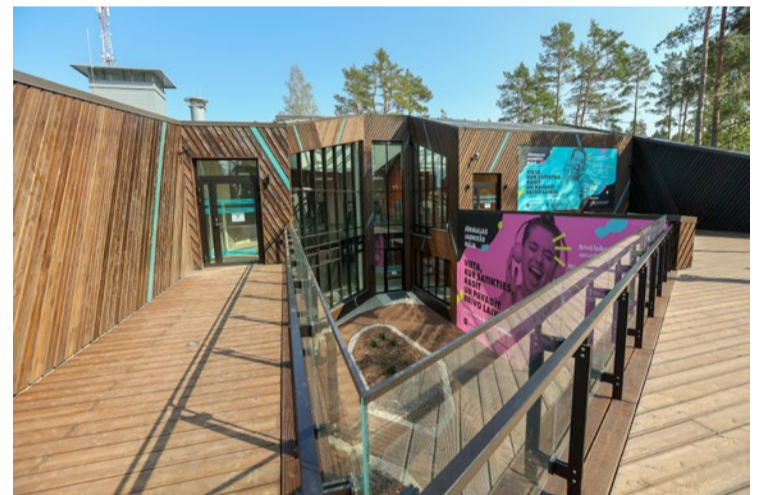
Uz jauniešu mājas ēkas jumta – plaša āra terase un vieta brīvdabas kino norisēm.