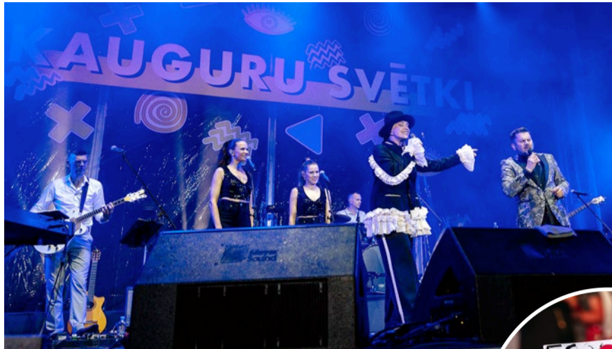
Vakarā uz lielās svētku skatuves apmeklētājus priecēja Laima Vaikule, Intars Busulis un Abonementa orķestris.