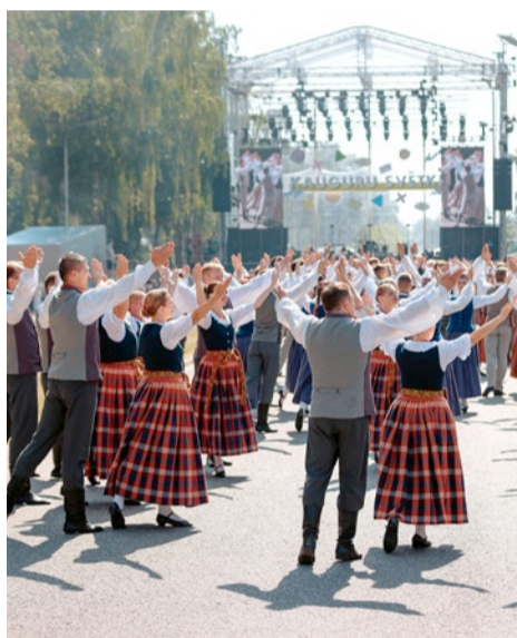
Kauguru svētkus ar latviešu tautisko deju Tallinas ielā iedejoja tautasdeju kolektīvi no dažādiem Latvijas novadiem.

Kauguru svētki pēc divu gadu pārtraukuma pulcēja tūkstošiem jūrmalnieku un pilsētas viesu.