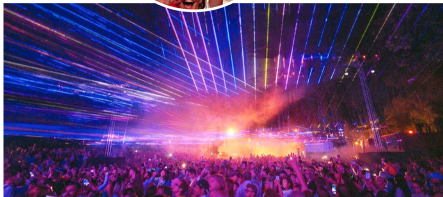
Svētku noslēgumā norisinājās vērienīgs lāzeru šovs, kas krāšņi izgaismoja debesis virs Kauguriem.

Kauguru svētki pēc divu gadu pārtraukuma pulcēja tūkstošiem jūrmalnieku un pilsētas viesu.