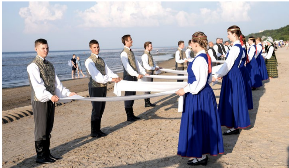
Festivāls "Jūras bize" Jaundubultu–Pumpuru līdā pulcēja vairāk nekā 600 deotāju no 35 tautasdeju kolektīviem Latvijā.