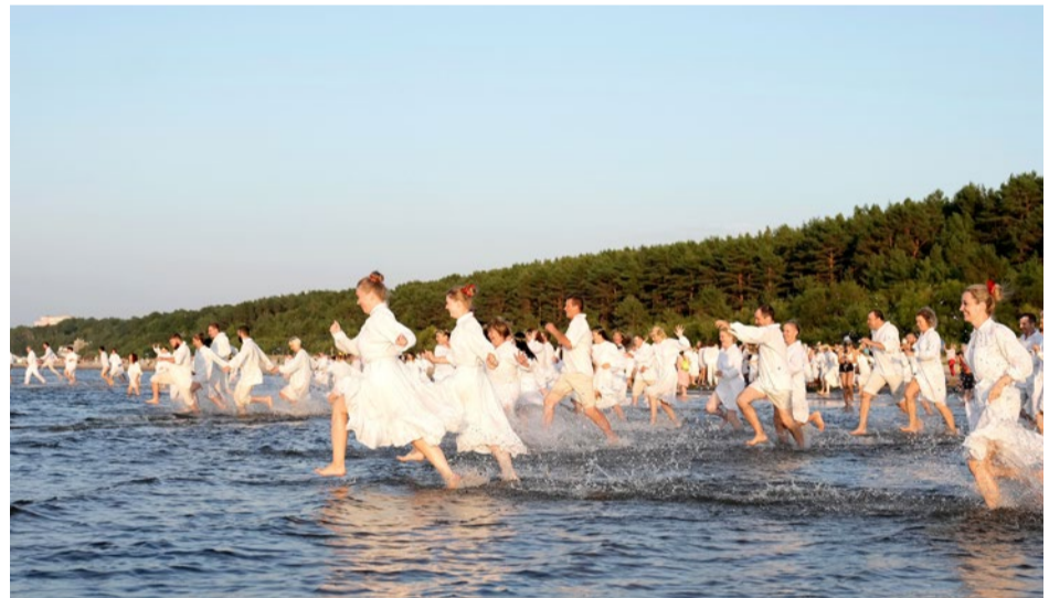
Tuvojoties saulrietam, deotāji, tērpušies baltos lina kreklos, devās veldzēties "Baltajā peldē".

Ķemeru svētkos apmeklētāji varēja izbaudīt Ķemeru kūrorta parka burvību, piedalīties izklaides un sporta pasākumos un apmeklēt amatnieku darinājumu un gardumu tirdziņu.