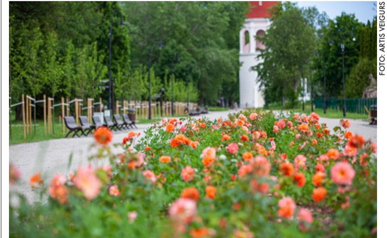
Kemeru parkā saglabāta vēsturiskā plānojuma kompozīcija, balstoties uz 1933.–1936. gada stilistiku.

9. jūnijā Latvijas Mākslas akadēmijā norisinājās Latvijas Ainavu arhitektūras balvas svinīgā apbalvošanas ceremonija, kur starptautiskās žūrijas balvu saņēma divi Jūrmalas dārzi.