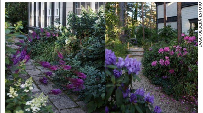
Privātajā dārzā Bulduru prospektā veidotas vairākas noskaņu telpas, maksimāli saudzējot vidi un sākotnējo noskaņu.

LATVIJAS AINAVU ARHITEKTU ASOCIĀCIJAS informācija