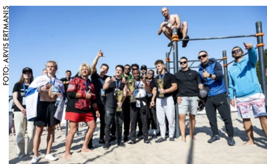
Majoru pludmalē Jūrmalā izcīnītais trīs godalgas Pasaules kausa posmā ielu vingrošanā.

LATVIJAS IELU VINGROŠANAS FEDERĀCIJAS informācija