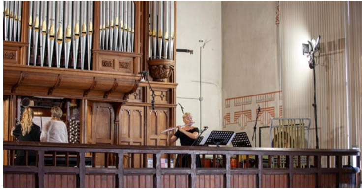
Dubultu baznīca lepojas ar lieliskām trīs manuāļu angļu ērģelēm, uz kurām var atskaņot dažādu laikmetu un stilu mūziku.