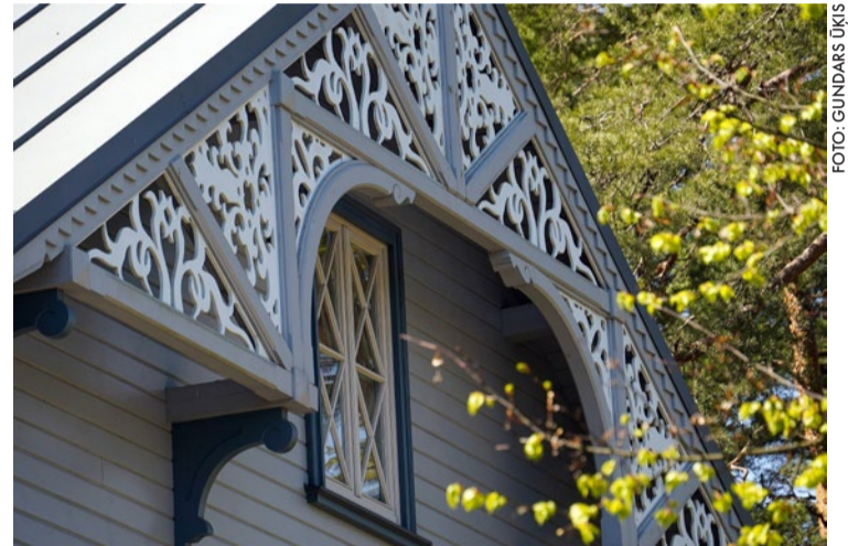
Arhitektūras mantojums ir nozīmīgs Jūrmalas pilsētas identitāti veidojošs faktors.

Lai izteiktu atzīnību iepriekšējā gadā viskvalitatīvāk atjaunoto, restaurēto un pārbūvēto vēsturisko ēku īpašniekiem, pašvaldība jau otro gadu piešķirs Jūrmalas vēsturiskās arhitektūras balvu.