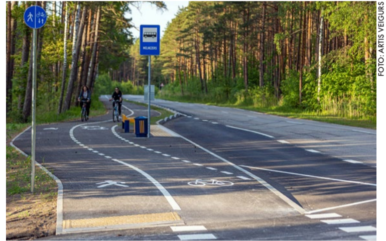
Izbūvētais gājēju un velosipēdu ceļš no Jaunķemeriem līdz Ķemeri vēsturiskajam parkam veicinās ērtu un drošu pārvietošanos, kā arī dabas un kultūras mantojuma objektu ilgtspējīgu pieejamību.

Papildus gājēju un velosipēdu ceļa izbūvei Jaunķemeri ceļa galā pirms izejas uz pludmali ir ierīkots laukums ar asfaltbetona segumu, nodrošinot gājējiem un velosipēdistiem ērtāku nokļūšanu līdz pludmalei. Būvdarbus veica personu apvienība "Igate – Liktenis", realizējot SIA "Global Project" 2021. gadā izstrādāto būvprojektu. Būvuzraudzību nodrošināja SIA "Somniar". Būvdarbi tika veikti Eiropas Jūrlietu un zivsaimniecības fonda (EJZF) līdzfinansētā projektā "Gājēju un velosipēdu ceļu infrastruktūras