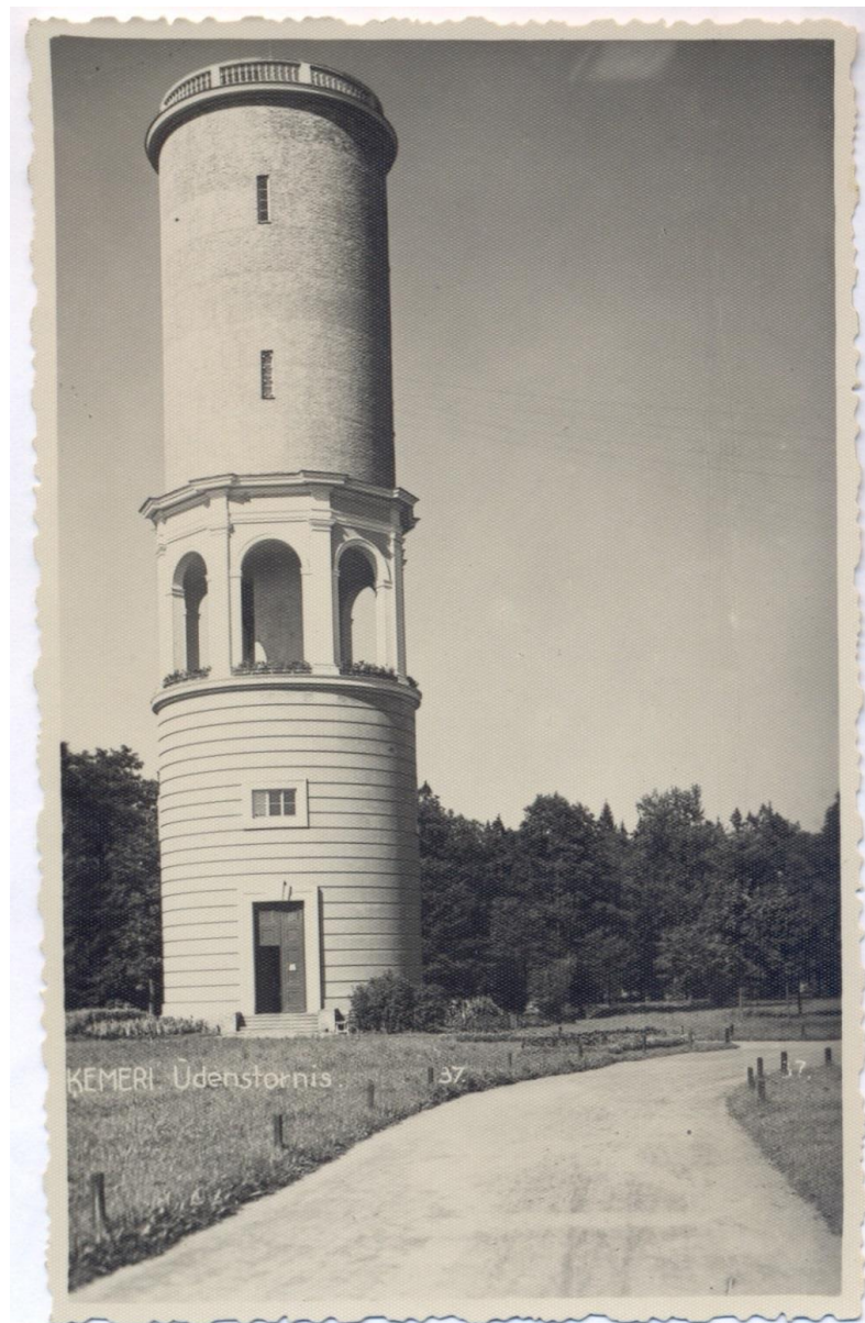
Jūrmala (2017) 2021