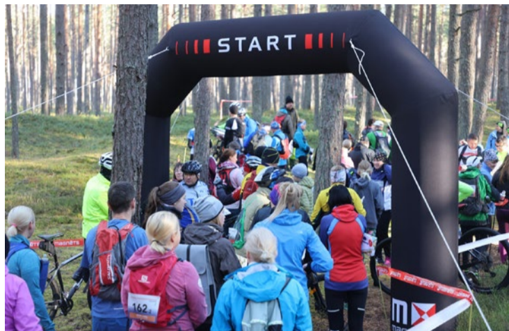
Rogainingings ir iespēja izbaudīt rudens krāšņumu, orientējoties pilsētā – ejot, skrienot vai braucot ar velosipēdu.

No plkst. 10.00 sāksies karšu izsniegšana rogaininginga distancē plānošanai;