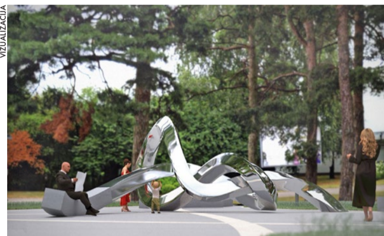
Tiks labiekārtota Kauguru Kultūras namam piegulošā teritorija, to papildinās vides objekts "Mezglis".

Jūrmalas Kultūrtelpas un vides dizaina centram uzdots noslēgt līgumu ar vides objekta autoru par tā izveidi, Jūrmalas valstspilsētas administrācija izsludinās iepirkumu konkursu vides objekta teritorijas labiekārtošanai. Kopējo projekta izmaksu indikatīvā tāme ir aptuveni 530 000 eiro, no tā vides objekta un solu izgatavošana un uzstādīšana sastāda 200 000, bet skvēra labiekārtošanas, tostarp visu inženiertehnisko komunikāciju, seguma, labiekārtojuma izveides un apzaļumošanas darbi – 330 000 eiro. Iespējams, iepirkumā tiks saņemts arī labāks izmaksu piedāvājums projekta realizācijai.