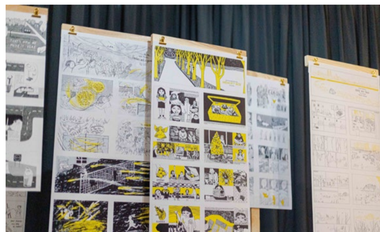
Projektā tapušie studentu darbi stāsta par Ukrainas bērnu un jauniešu pieredzēto karā.