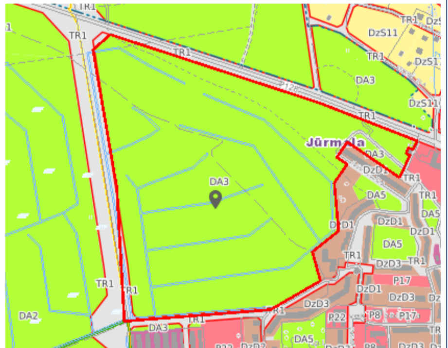
Ekrānuzņēmums no valsts vienotā ģeotelpiskās informācijas portāla geolattija.lv