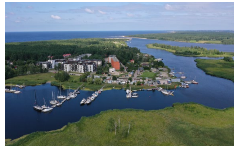
Jūrmalas ostas pārvalde pieteiks projektu Lielupes kreisā krasta nostiprinājuma izbūvei Lielupes grīvas teritorijā.

Atbalstīja Jūrmalas ostas pārvaldes dalību projektu ideju priekšatlases konkursā ar projekta idejas pieteikumu Lielupes kreisā krasta nostiprinājuma izbūvei Lielupes grīvas teritorijā (ieteka jūrā). Projekta īstenošanas rezultātā tiktu mazināts plūdu risks un atsevišķu Jūrmalas teritoriju krasta erozija, mazināti smilšu sanesumi un padziļināts kuģošanas ceļš Lielupes grīvā, kas nodrošina Jūrmalas ostas turpmākai darbībai nepieciešamo navigāciju. Projekta kopējās indikatīvās izmaksas ir 5 000 000,00 eiro, kur ERAF finansējums ir 4 250 000,00 eiro (85%), Jūrma-