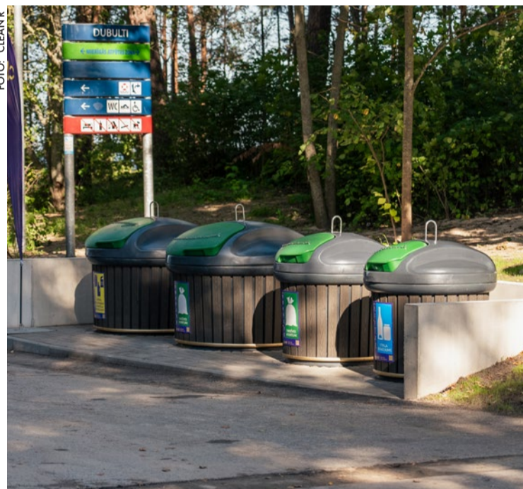
Jaukie pazemes konteineri paredzēti gan sadzīves, gan šķirotajiem atkritumiem – stiklam un vieglajam iepakojumam.