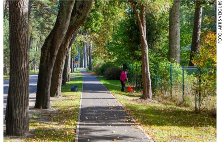
Sniedzot atbalstu iedzīvotājiem, pašvaldība nodrošinās savāktu rudens lapu izvešanu.

Maisu izvietošana ārpus sava īpašuma teritorijas, ielu malās,