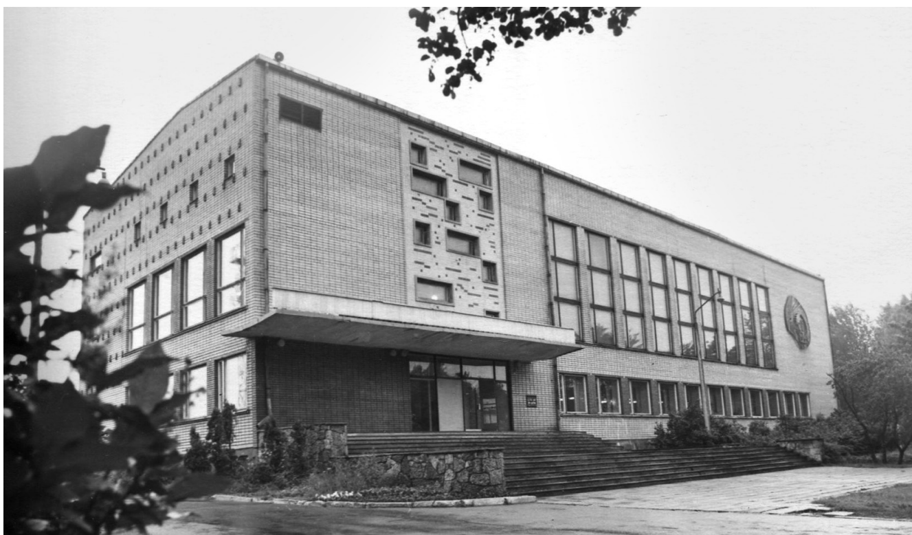
Slokas CPF Kultūras nams. 20.gs. 70.gadi. Jūrmalas muzeja krājums