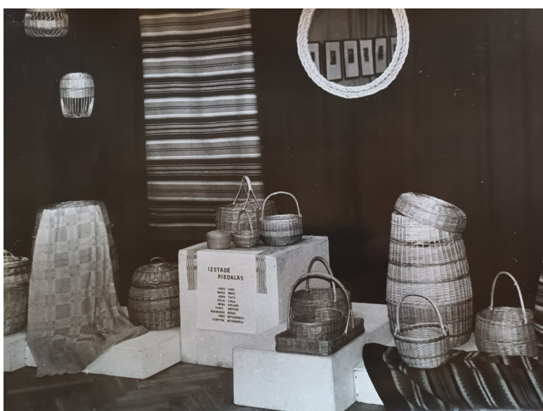
Bulduru audēju darbu un zvejnieku kolhoza "Uzvara" pinēju pulciņa dalībnieku kopizstāde. 20.gs. 80.gadu 2.puse.