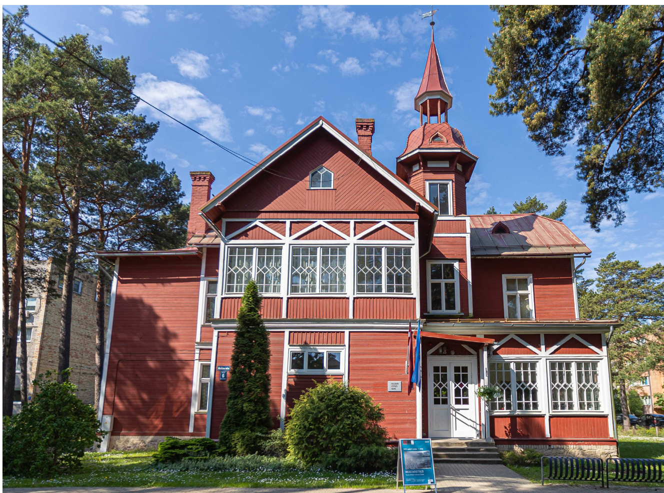
Bulduru Izstāžu nams Muižas ielā 6.