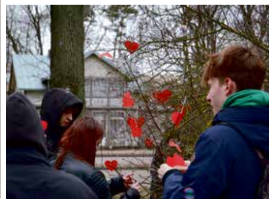
Rīkojot zibakciju Zigfrīda Meierovica prospektā, jauniešu mērķis ir pievērst plašāku uzmanību nesakārtoto Jūrmalas vēsturisko ēku problemātikai, uzsverot ēku īpašnieku atbildību.

JŪRMALAS KULTŪRTELPA UN VIDES DIZAINA CENTRS