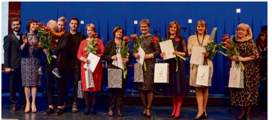
Piešķirti Pateicības raksti par ieguldījumu kultūras dzīves veidošanā.

Augustā Asaru apkaimē rīkotais festivāls "V-asarnieks" balsojumā ieguvis vislielāko skatītāju balsu skaitu. Pasākums pulcēja vietējo apkaimju iedzīvotājus, kaimiņus un draugus, lai satiktos,