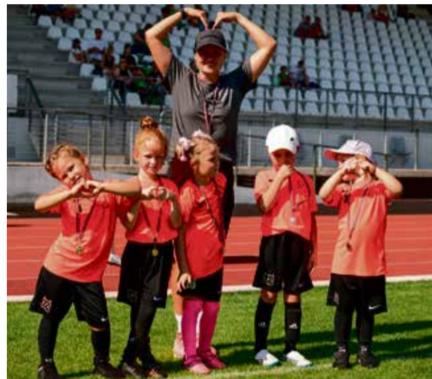
Futbols ir piemērots gandrīz ikvienam! Futbola spēle ir veids, kā ar prieku un aizrautību pavadīt aktīvu laiku kopā ar draugiem.

sava bērna iespējamo karjeru sportā. Pieaugušā iesaiste ir nozīmīgs elements bērnu sportiskajā attīstībā, turpretī jauniešiem šis var būt pirmais solis sporta trenera karjerā. Skola uzņems savā pulkā jaunos "Grassroots" līderus, kuri būs veiksmīgi apguvuši kursus. Aicinām ikvienu, kurš ir gatavs veicināt un popularizēt bērnu un jauniešu sportiski aktīvu un veselīgu dzīvesveidu Jūrmalā!