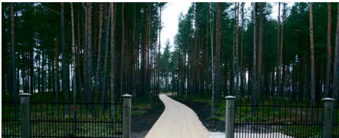
Kapavietu pieejamība Jūrmalā ir aktuāls jautājums: brīvo kapavietu skaits arvien samazinās, risinājumi jaunu kapsētu ierīkošanai tiek meklēti.

Detālplānojuma izstrādei ir izvirzītas papildu prasības, tostarp veikt