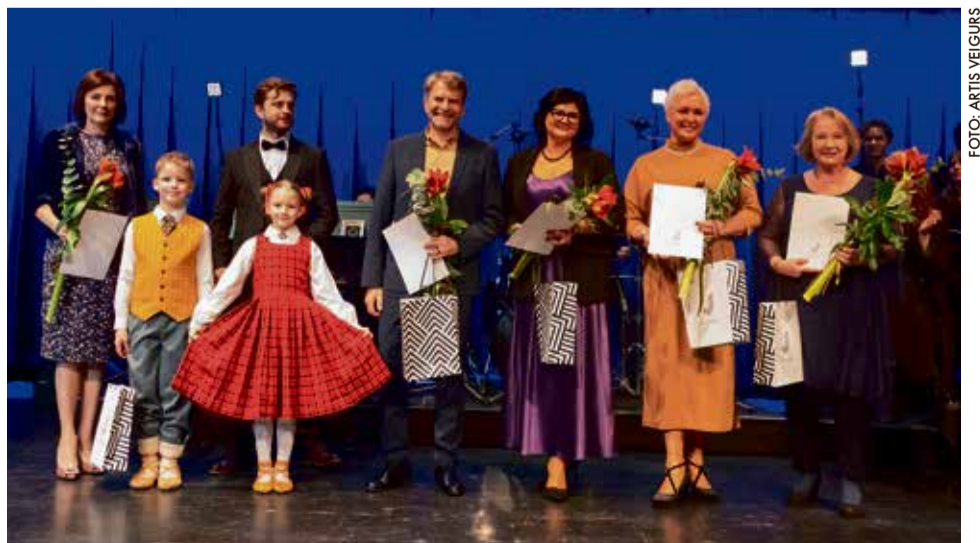
Saņemtas Pateicības raksti par Jūrmalas kolektīvu koordinēšanu dziesmu un deju svētkos.