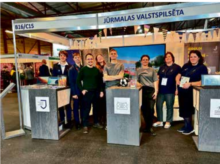
Jūrmalas izglītības iestāžu pārstāvji izstādē "Skola 2024".