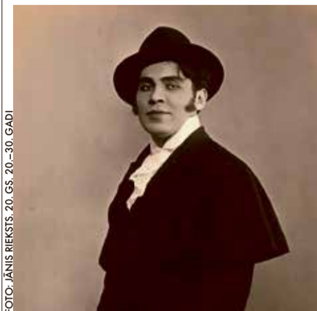
20. GS. 20.-30. GADI