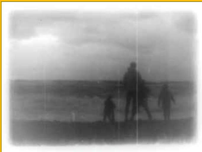
Stopkads no 8mm filmas

Piecās biennāles mākslas izstādēs jauniešu un pieaugušo auditorijas tiks uzrunātas domnīcu – diskusiju formātā. Pieaicinot diskusiju moderatorus – dažādu nozaru pārstāvjus – tiks aktualizēta katras izstādes tēma un problemātika. Domnīcas tiks integrētas laikmetīgās mākslas un glezniecības izstādēs Jūrmalas pilsētas muzejā, Aspazijas mājā, Bulduru Izstāžu namā un Jūrmalas Brīvdabas muzejā. Formāts tiks pielāgots epidemioloģiskajai situācijai vasarā.