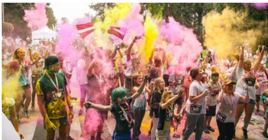
Kauguros aizvadīts gada krāsainākais notikums – Jūrmalas Krāsu skrējieni, kurā dalībniekiem piecu kilometru distancē bija iespēja piedzīvot krāsu festivāla atmosfēru.