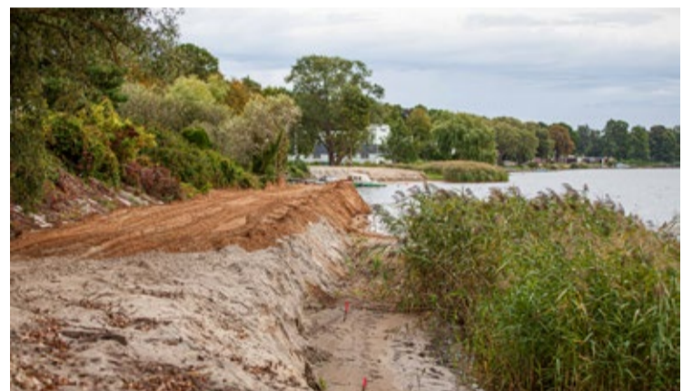
Apjomīgi būvdarbi krasta nostiprinājuma izbūvei šobrīd norisinās Straumes ielā.

Aktīvi būvdarbi tiks turpināti līdz šī gada oktobrim, kad sākas ceļotājzivju rudens migrācijas laiks. Pārtraukuma periodā aizsargbūves izbūve tiks turpināta