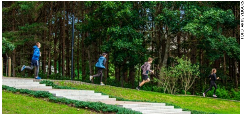
Nodarbības tiem, kam gribas pabūt svaigā gaisā, izkustēties un aizraujošā veidā iepazīt sportu.

Viens no atbalsta veidiem Covid-19 seku mazināšanai ir individuāls mentoringis. Daļa jauniešu aptaujā izteikuši nepieciešamību pēc šāda atbalsta veida, tāpēc no septembra Jūrmalas Jaunatnes iniciatīvu centrā ar sertificēta vadītāja atbalstu būs iespēja apgūt The Duke of Edinburgh's International Award programmu, kas rosina jau-