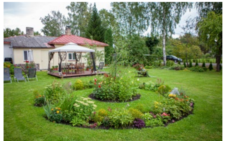
Konkursa godalgu individuālo dzīvojamo māju grupā saņēma īpašums Dundagas ielā 4a.