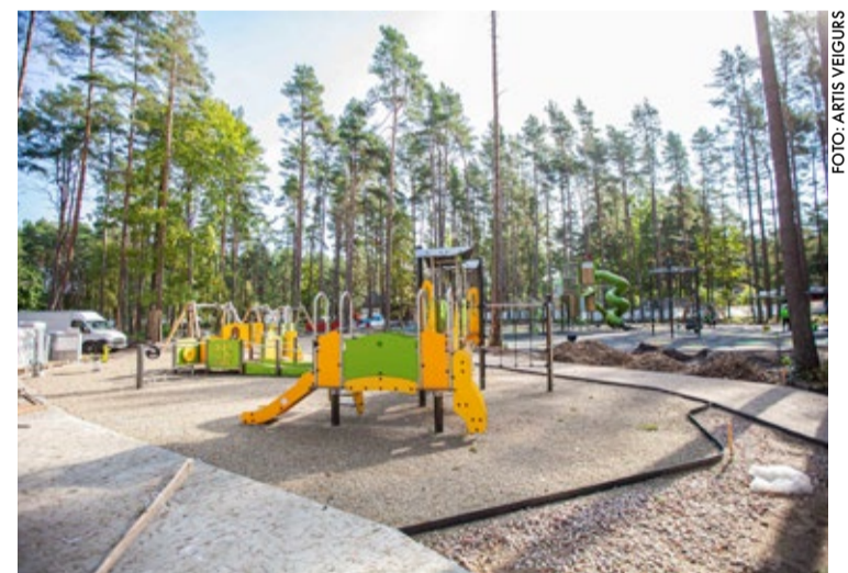
Rotaļu laukums paredzēts dažādu vecumu bērniem. Šobrīd ir uzstādītas rotaļu ierīces, tiek ieklāts laukuma segums.

būve. Jauniešu mājas ēkai ir paredzēti divi stāvi ar telpu kopējo platību 1805 kvadrātmetri. Pirmajā stāvā būs telpas Jūrmalas Bērnu un jauniešu interešu centram un Jūrmalas Jaunatnes iniciatīvu centram, arī mūzikas un foto studijai, tehniskajai studijai un resursu centram, kā arī telpas uzņēmējiem – kafējnīca, bērnu rotaļu istaba, labierīcības un tehniskās telpas. Otrajā stāvā ir paredzēta daudzfunkcionāla zāle un biroju