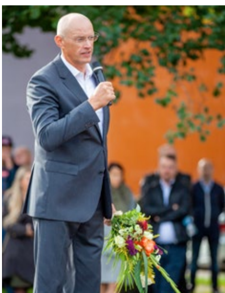
Domes priekšsēdētājs Gatis Truksnis sveic skolēnus un pedagogus Jūrmalas Valsts ģimnāzijā. Jauno mācību gadu ģimnāzijā šogad uzsāk 729 audzēkņi – par 21 vairāk nekā pērn.