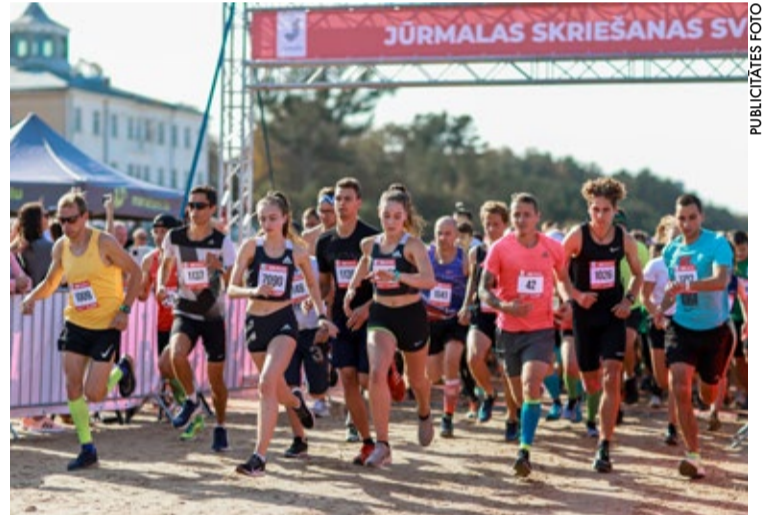
Skrējiena distance ir veidota apļos gar jūras krastu, tādējādi nodrošinot kāju un muguras veselībai labvēlīgu smilšu segumu.

Aicinām sekot līdzī iespējamām izmaiņām pasākuma norisē!