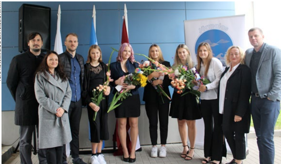
Jūrmalas Sporta skolas vadība sveic Basketbola nodaļas audzēknes un trenerus.