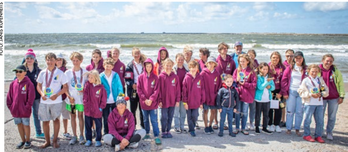
Jūrmalas jaunie burātāji ar treneriem pēc veiksmīga starta sacensībās.