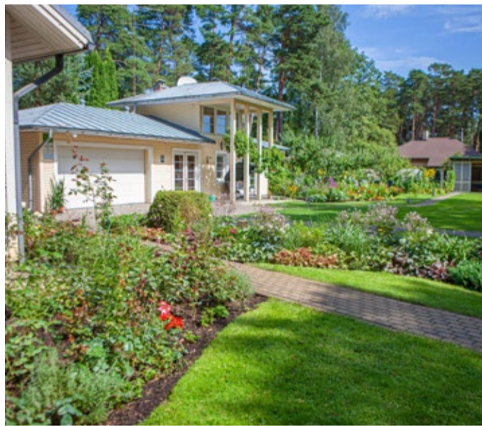
Īpašums Edinburgas prospektā konkursos guvis augstākās godalgas vairākus gadus. Īpašuma saimniece – Inga Šīna.