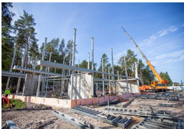
Jauniešu mājai izbūvēti pamatu pāji, un šobrīd tiek veikti kolonnu un siju montāžas darbi, kā arī dzelzsbetona sienu pamatu izbūve.

Bērnu rotaļu zonā ir uzstādīti 22 rotaļu laukuma elementi, kas paredzēti pirmsskolas un skolas ve-