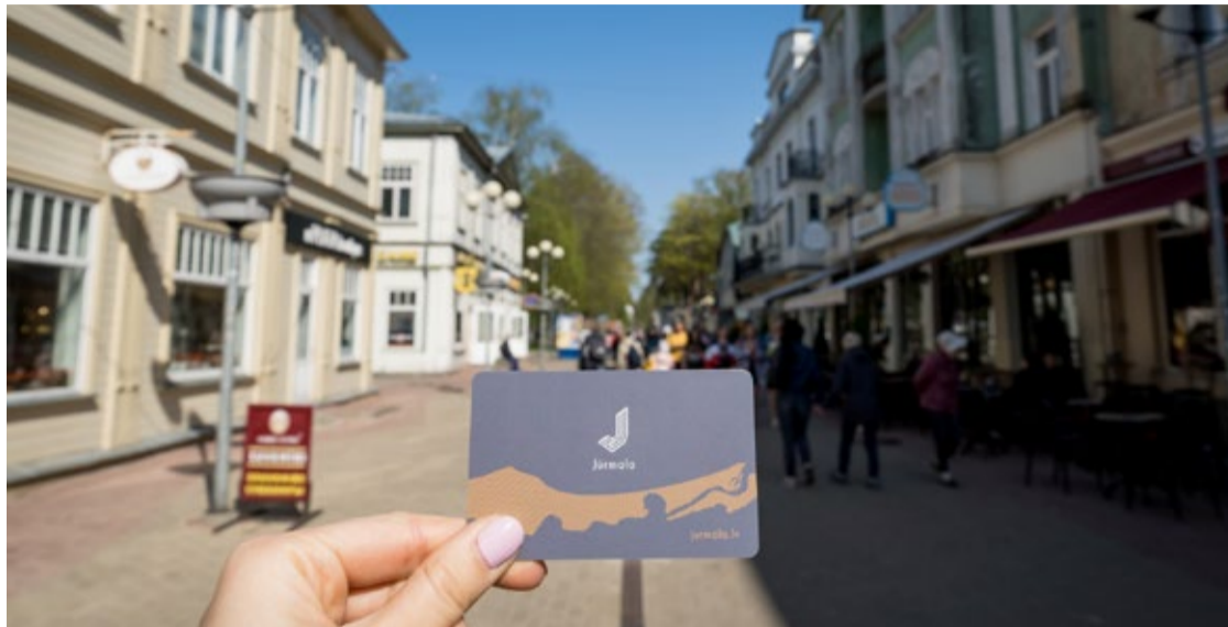
Jūrmalas iedzīvotāja karte tās īpašniekam dod iespēju ar atlaidi iegādāties preces un saņemt pakalpojumus, ko piedāvā vairāki pilsētas uzņēmumi.

Karte pirmreizēji tiek izsniegta bez maksas, ja iedzīvotājs ir deklarēts vai tam pieder nekustamais īpašums Jūrmalas valstspilsētas pašvaldības administratīvajā teritorijā. Patlaban Jūrmalas iedzīvo-