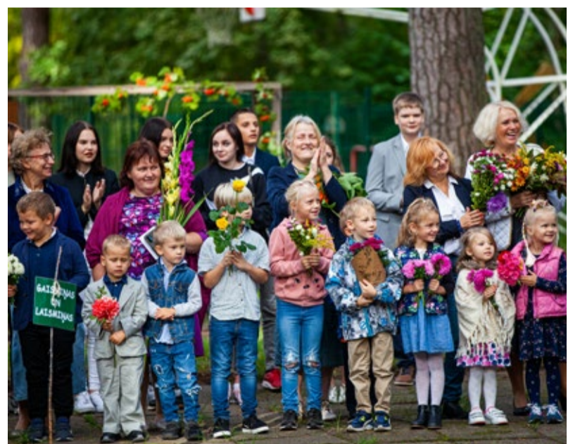
Vaivaru pamatskolā Zinību dienā skolēnus sagaida pirmsskolēni.