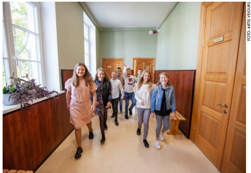
Pēc vasaras brīvlaika atkalredzēšanās prieks valda Ķemeru pamatskolā.