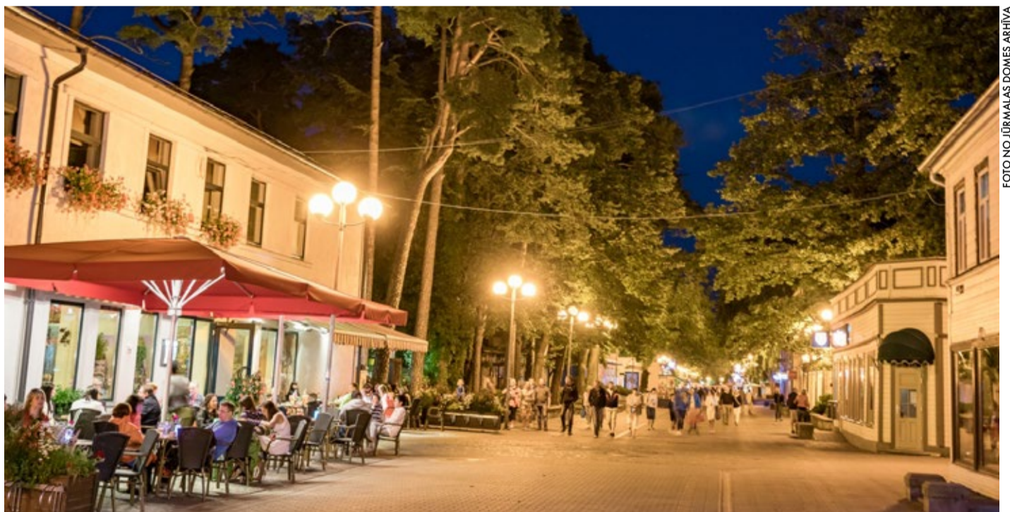
Jomas ielā, pārbūvējot apgaismojumu, tiks saglabāti Jomas ielai raksturīgie apaļā dizaina gaismekļi.

Asaru prospektā tiek renovēta apgaismojuma līnija posmā no Atbalss ielas līdz Valteru prospektam. Būvdarbu laikā paredzēts nomainīt 100 apgaismojuma stabus pret jauniem, cinkotiem stabiem, tiks ieguldīts apgaismojuma kabelis vairāk nekā