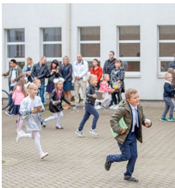
Pirmā skolas diena Slokas pamatskolā. Zinību dienā pirmklasniekiem pašvaldība dāvināja izglītojošu spēli.