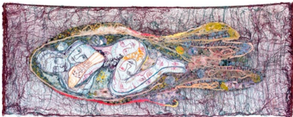
Ilze Rudzīte. “Ceļojums”. 2018. Jaukta tehnika.