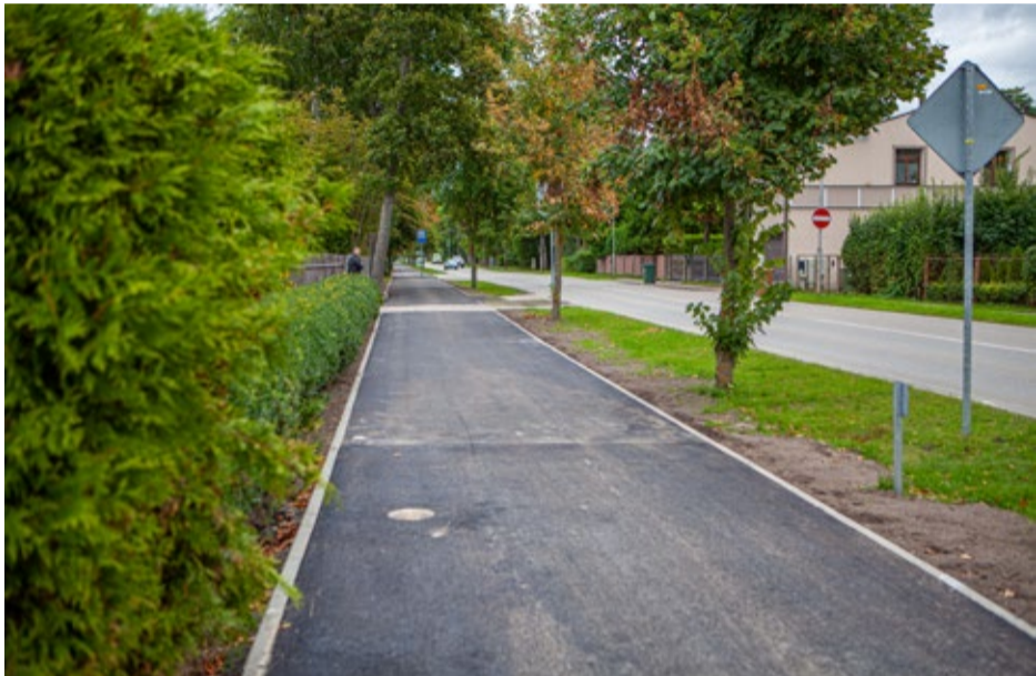
Dubultu apkaimē ir pabeigti gājēju un velosipēdu celiņa seguma atjaunošanas darbi Dubultu prospekta posmā no Braslas ielas līdz Līgatnes ielai.

Infrastruktūras investīciju projektu nodaļa