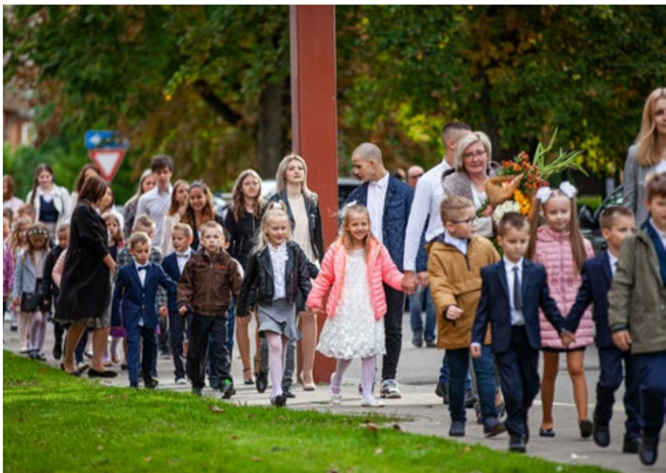
Pirmklasniekus skolas gaitās tradicionāli ievada vecāko klašu skolēni. Attēlā: Jūrmalas Valsts ģimnāzijas audzēkņi.

skolām inventāra, mācību līdzekļu, pamatlīdzekļu un mācību grāmatu iegādei