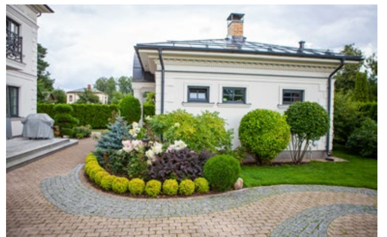
Konkursa godalga piešķirta īpašuma Kauņas ielā saimniekiem.