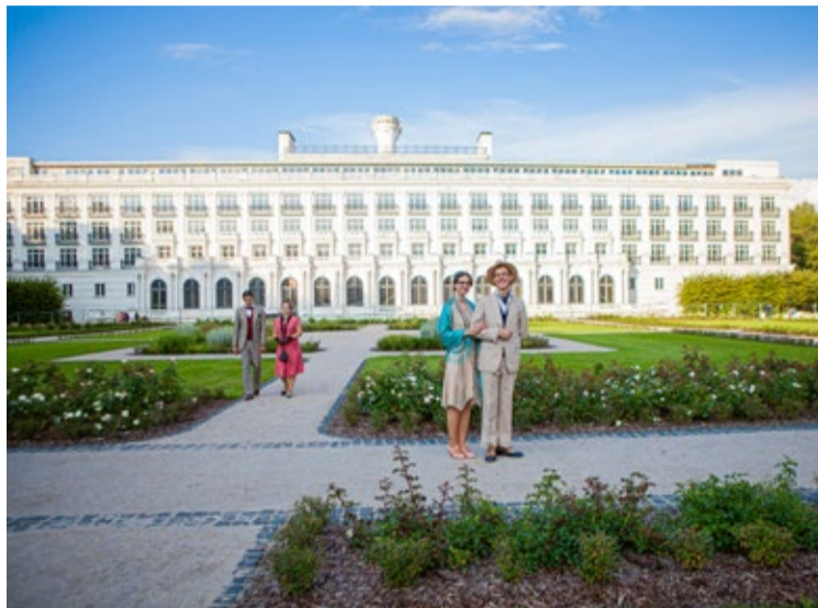
13. augustā atklāts atjaunotais un pārbūvētais Ķemeru vēsturiskais parks. Atklāšanas dienās apmeklētājus priecēja 30. gadu melodijas un romantiski lasījumi uz Mīlestības saliņas, parkā pastaigājās un fotografējās kūrorta viesi. Aicinām apmeklētājus būt saudzīgiem, nebojāt parka labiekārtojumu un inventāru, neplūkt augus!

Augusts Jūrmalā bijis vēsturiskiem, kultūras un sporta notikumiem un aktivitātēm bagāts: atklāts atjaunotais Ķemeru kultūrvēsturiskais parks, aizvadīta Kauguru diena, Jūrmalas Krāsu skrējieni un velomaratons, bet pilsētas jaunieši vasaras noslēgumā rīkoja Jūrmalas jauniešu dienu.