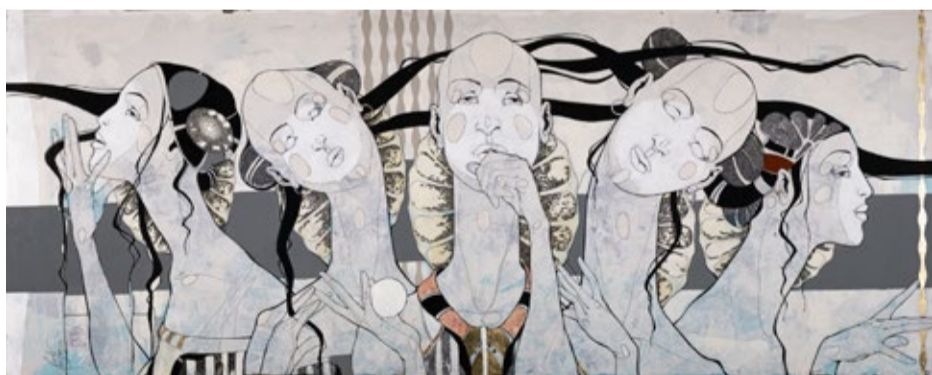
Roberts Koļcovs. “Ādams un četras levas”. 2021. Audeklis, akrils, tuša.