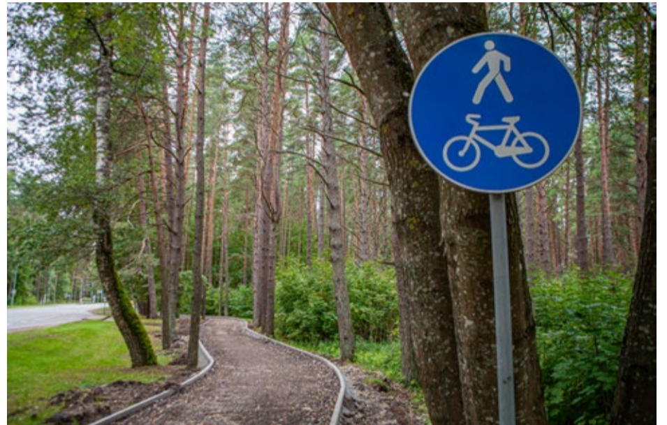
Kauguru apkaimē tuvāko nedēļu laikā tiks pabeigta gājēju un veloceļa atjaunošana posmā no Līņu ielas līdz Atbalss ielai.