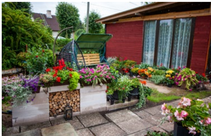
Košas puķudobes Dundagas ielā 4.