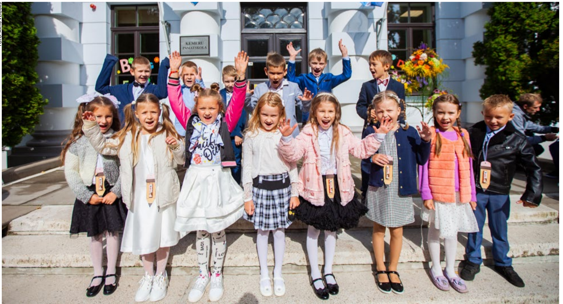
Ķemeru pamatskolas audzēkņiem ir prieks mācīties atjaunotajā vēsturiskajā skolas ēkā, skaistā un sakārtotā vidē.

Kopš 1. septembra Jūrmalas skolas atkal piepilda bērnu čalas – skolēni, pedagogi un bērnu vecāki ir apņēmības pilni atsākt klātienes darbu.